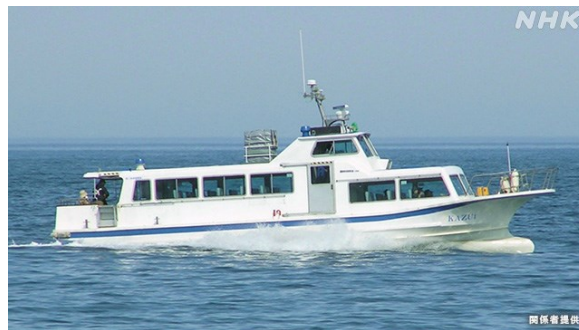
図.1 遭難した知床遊覧船の KAZU1

A: 2022年4月23日、乗客・乗員26人を乗せて斜里町ウトロを出港した観光船業者「知床遊覧船」の観光船「KAZU1」が「エンジンが停止して船体前部が浸水して30°近く傾いている」と通報したまま知床半島の沿岸で沈没しました。現在、14人の死亡が確認され、残り12名が行方不明になっています。通報があった場所の近くで船体が水深120メートルの海底に沈んでいることがわかり、国交省が引き揚げを検討しています。事故当時の現地は波浪3メートルの悪天候でした。KAZU1は前年の5月と6月にそれぞれ浮遊物との衝突と浅瀬への座礁を経験しています。